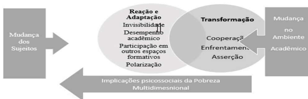
Figura 2 – Estratégias Específicas e seus níveis de enfrentamento

Ressalta-se ainda que as estratégias de enfrentamento específicas do Ensino Superior aqui relatadas são todas relevantes e necessárias como mecanismos possíveis de permanecer no meio acadêmico. Portanto, cabe visualizar como elas se colocam em termos de enfrentamento das implicações psicossociais da pobreza (Figura 2).