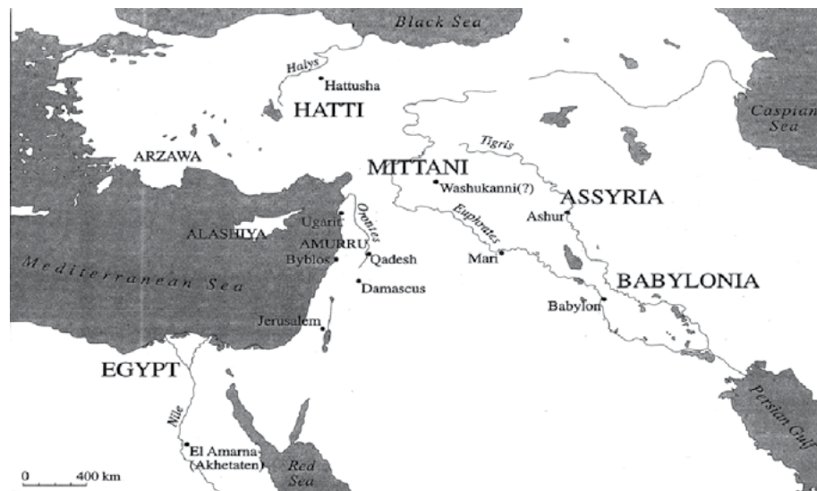
MAPA 1 – O Oriente Próximo Antigo, aproximadamente 1350 a.C.,