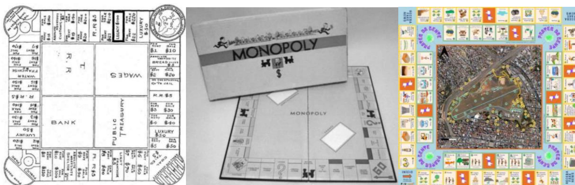
Figura 01- Tabuleiros dos jogos Landlord's Game , Monopoly e Prates da Gente (na sequência)

O debate sobre a apropriação da terra, e a pobreza ou a riqueza que ela proporciona à sociedade, apresenta três dimensões, que são inseparáveis em cada jogo: (1) moral (se a privatização da terra é ou não um roubo), (2) funcionalista (que ideias sobre a terra são disseminadas por meio do entretenimento) e (3) ética (quem tem o direito sobre a terra).