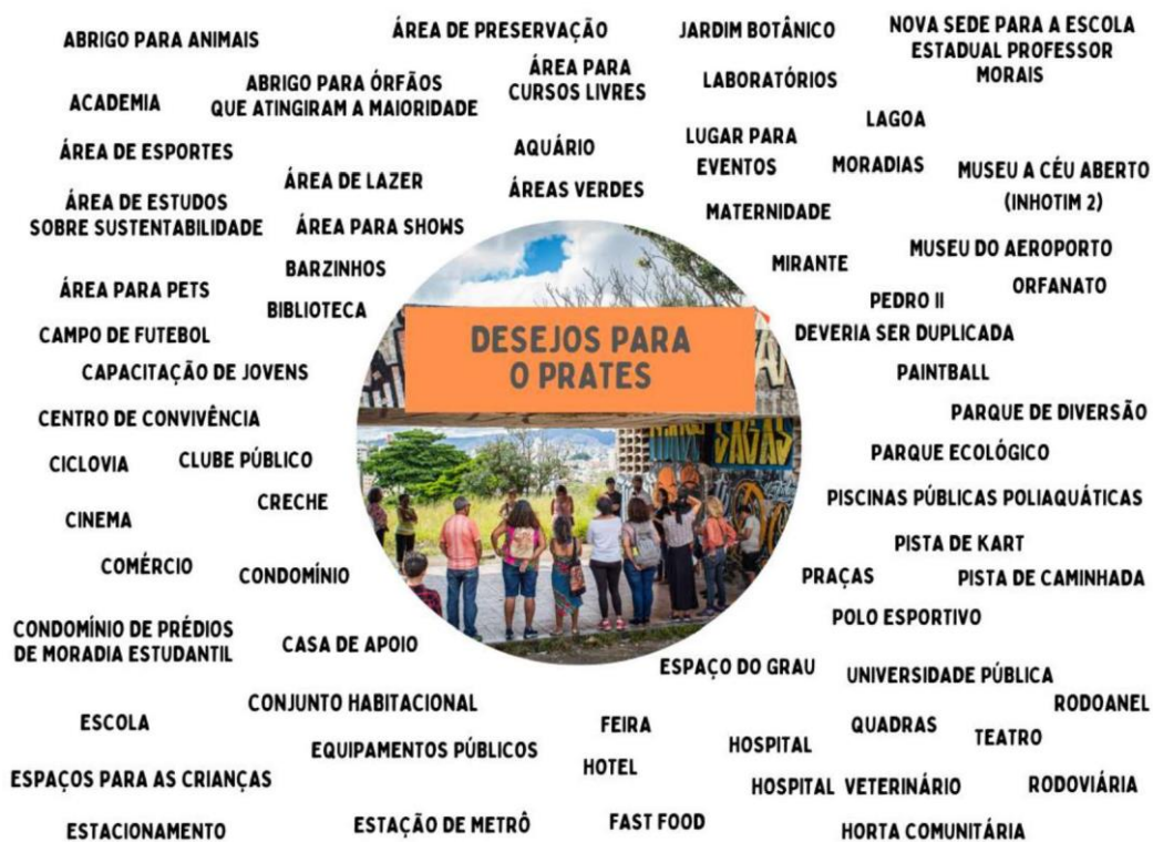
Figura 05 - Desejos para o Prates