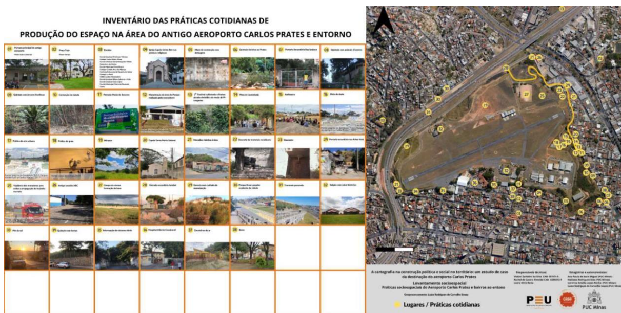
Figura 04 - Inventário das práticas cotidianas de produção do espaço na área do antigo aeroporto Carlos Prates e entorno

Realizamos as cartografias sociais colaborativas com os moradores dos bairros Caiçara Adelaide, Caiçaras, Jardim Montanhês, Monsenhor Messias, Dom Bosco, Jardim São José, Carlos Prates e com os estudantes do ensino médio da escola estadual Professor Moraes (Figura 04). Nas atividades realizadas na escola, a produção dessas cartografias envolveu: (a) o reconhecimento do território pelos alunos, por meio de uma visita técnica e uma oficina de fotografia, cujo registro foi realizado em seis grupos de WhatsApp para as seis turmas de 3º ano, com o nome de “Memórias do Aeroporto”; (b) várias oficinas temáticas sobre a dinâmica urbana da região; (c) uma oficina de desenho para o reconhecimento das dinâmicas do território, quando os estudantes se localizaram e realizaram desenhos e textos para externalizar suas ideias e propostas para a área do antigo Aeroporto Carlos Prates; (d) uma Miniconferência em que os grupos apresentaram suas propostas e ao final realizaram uma votação para escolher o melhor projeto e (e) exposição Urbanismo Cidadão: o que queremos para o Prates, realizada no anexo e no foyer do Teatro João Paulo II, na PUC Minas.