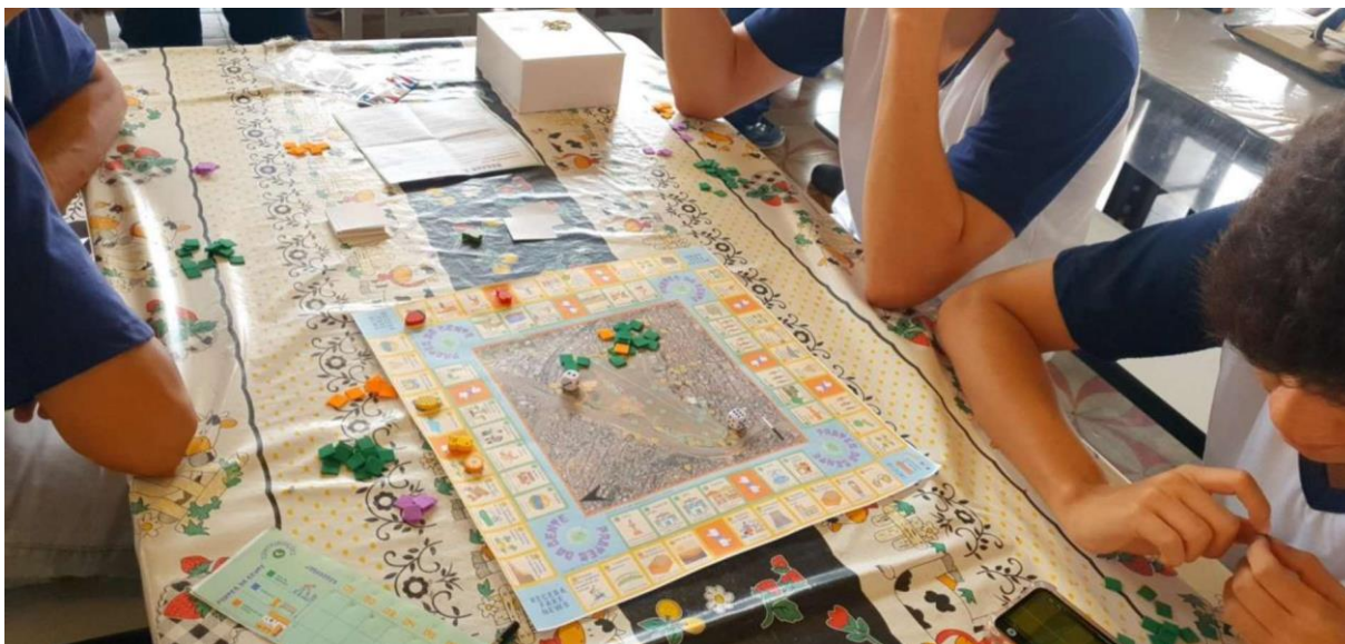
Figura 03 - Peças do jogo Prates da Gente