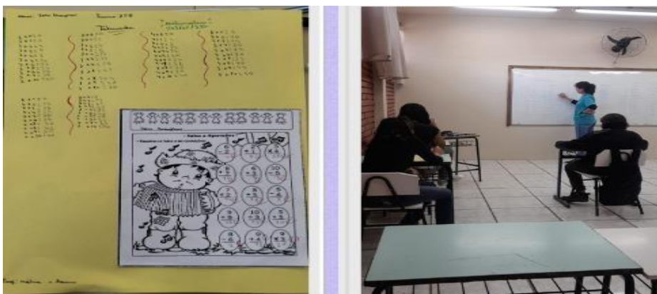
Figura 2 - Projeto de extensão de Reforço escolar nas escolas de Itaquí