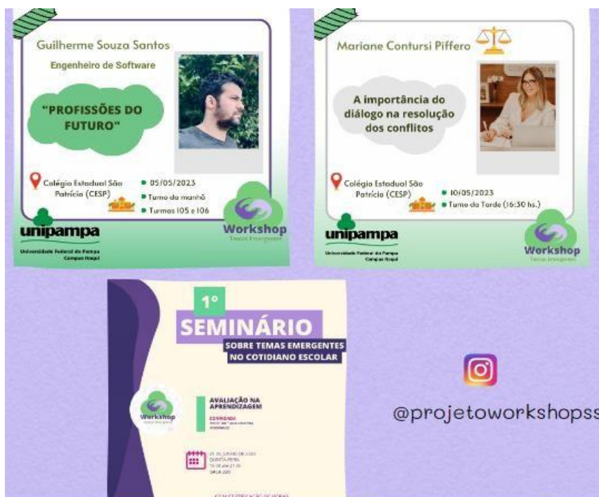
Figura 3 - Projeto de extensão Workshops sobre temas emergentes no contexto escolar