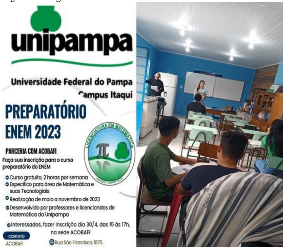
Figura 5 - Programa Extensão Universitária em Centros Socioeducativos