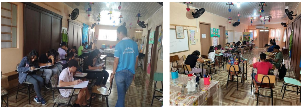
Figura 1 - Projeto de extensão Crescendo com a Matemática no Teresiano